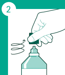
Girar a tampa no sentido horário.