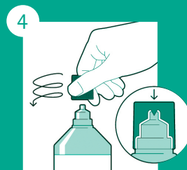
Recolocar a tampa girando em sentido anti-horário até romper o lacre.